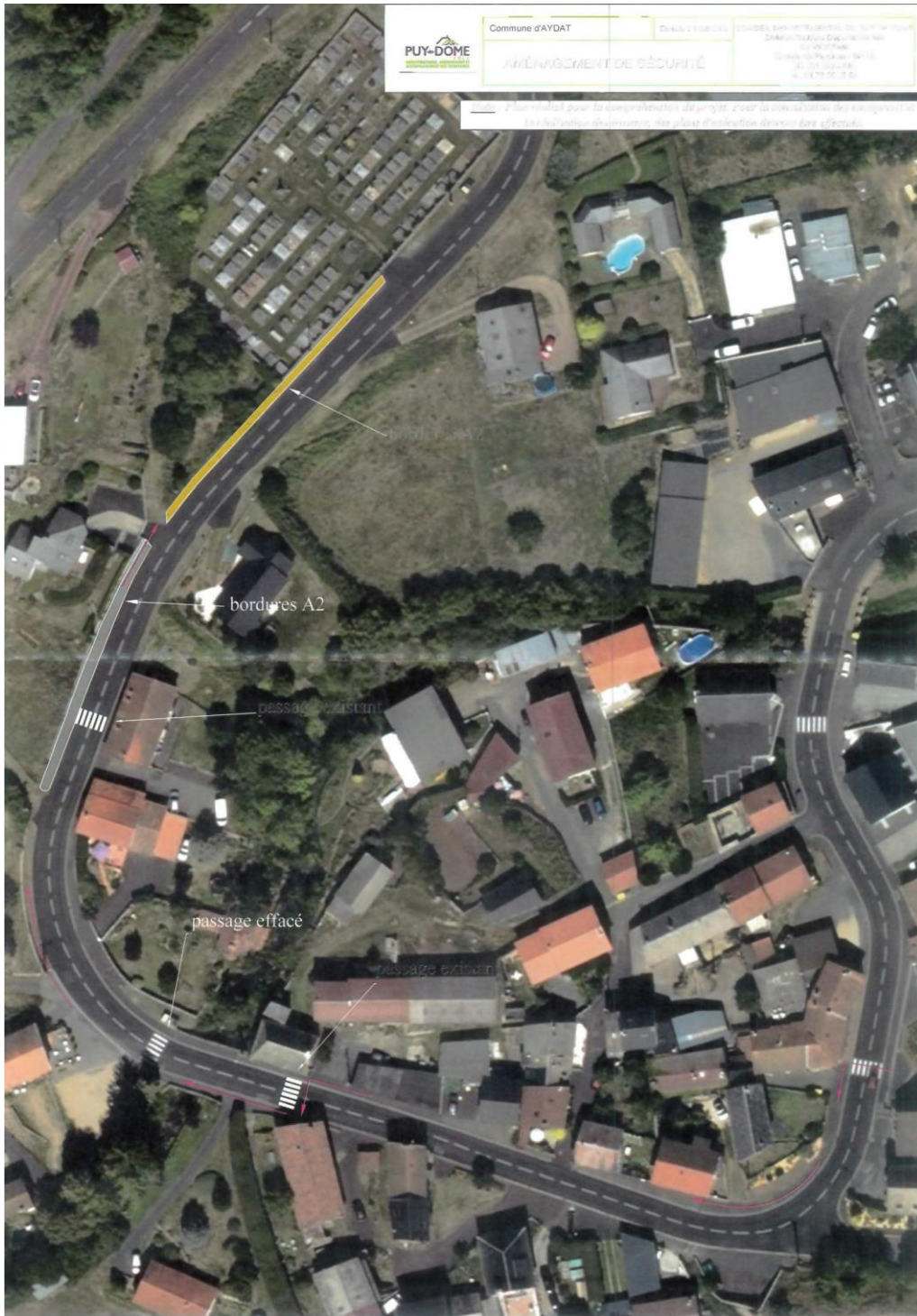
Aménagement (tracé jaune) rue Sidoine Apollinaire